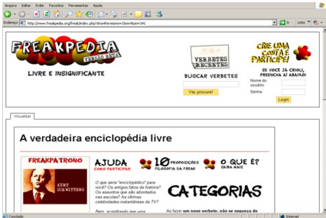
Figura 1 - Página Principal da Freakpedia (www.freakpedia.org)

colaborativo em que são aceitas contribuições de verbetes de pouca ou nenhuma relevância para toda a humanidade. Em outras palavras, subverte-se a idéia do rigor enciclopédico para dar espaço aos fatos, assuntos e personalidades que estariam distantes da importância ansiada em outras enciclopédias, tendo como único pré-requisito, a veracidade daquilo que é publicado. Como uma síntese das idéias trazidas nesta “enciclopédia estranha”, há 10 proposições iniciais que conduzirão conceitualmente aqueles que participarão do projeto: